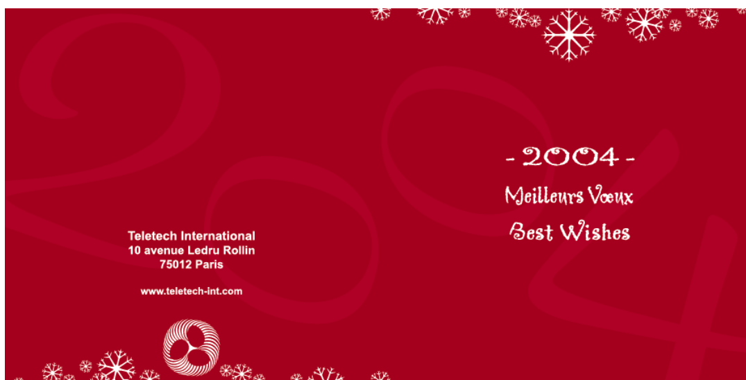
1 er Visuel de la carte de vœux 2004 de Teletech International

Sur la face avant, la présentation des vœux est inscrite au centre dans la police de caractère "Grey mantle MV" avec des modifications apportées au niveau de certaines majuscules par l'ajout d'une petite arabesque comme celles présentes sur 2004 (utilisation de cette police pour son aspect neigeux!). En haut, j'ai disposé une série de flocons qui se retrouvent aussi sur la face arrière par symétrie avec le logo de Teletech International en blanc qui remplace le flocon principal de la face avant. Le nom et l'adresse de la société se situent au centre de la face arrière en "Arial".