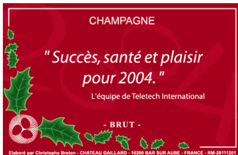
Visuel de l'étiquette de vin 2004 de Teletech International