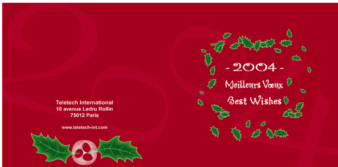
3 ème Visuel de la carte de vœux 2004 de Teletech International

Cette déclinaison reprend en grande partie le développement de la première au niveau du texte mais avec l'ajout de façon aléatoire de feuilles de houx autour des vœux sur la face avant et sur la face arrière une mise en scène d'une branche de houx autour du logo de Teletech International (dont les œufs simulent le fruit rouge du houx).