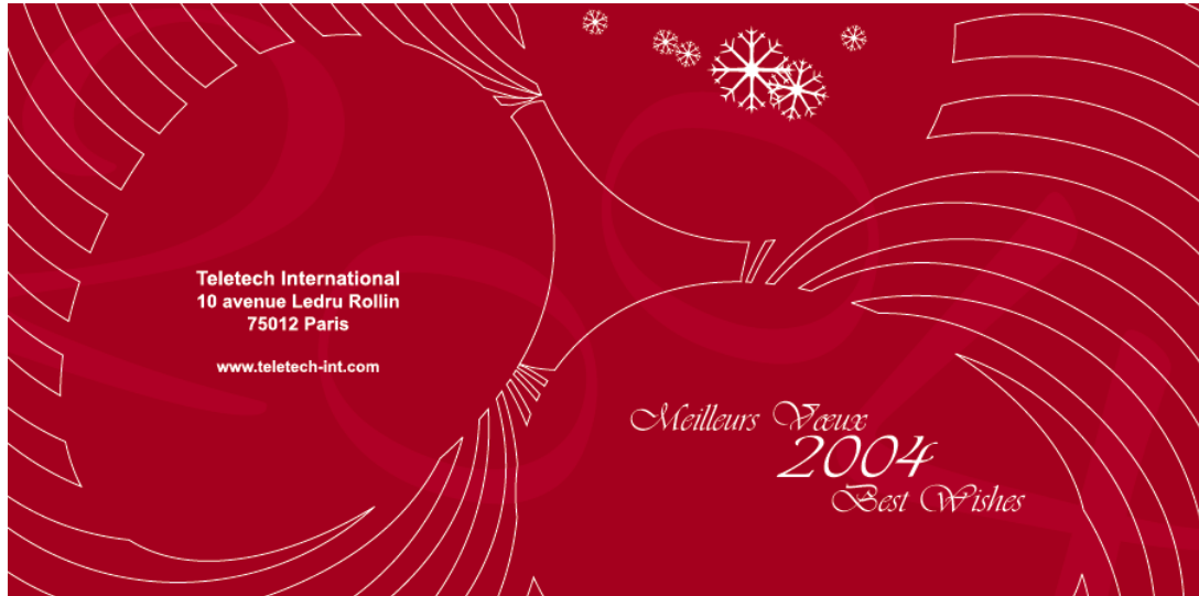
2 ème Visuel de la carte de vœux 2004 de Teletech International